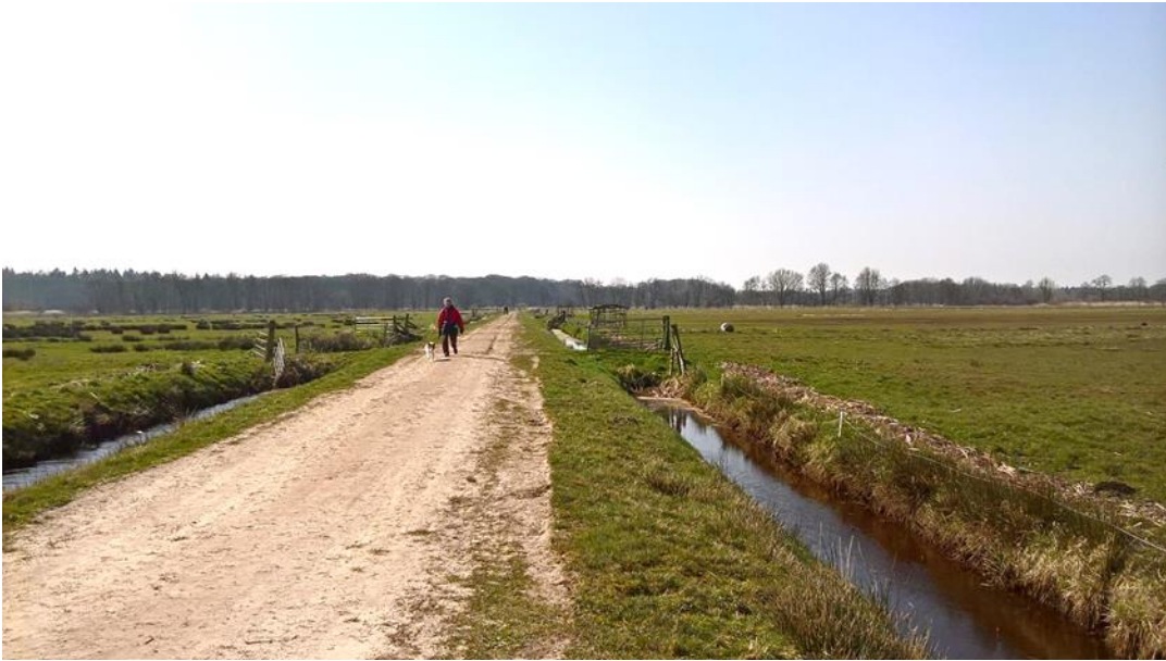
Achtermade weg in polder Lappenvoort (dal Drentsche Aa) zoals die er eeuwen bij lag