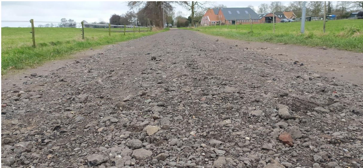
Grove stukken freesasfalt op de Koelandsdrift