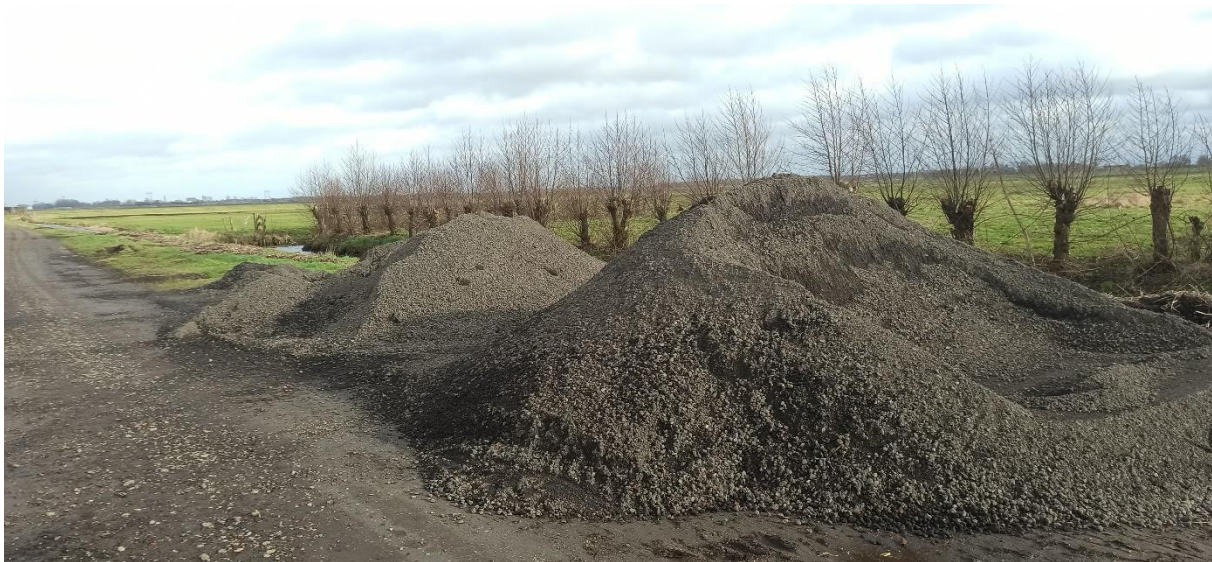
Op en overslag van asfaltgranulaat midden in een vogelweide beschermingsgebied

Het is onbegrijpelijk dat er een op- en overslag van asfaltgranulaat op de Zuiderhooidijk is ingericht midden in een natuurgebied. Notabene naast een perceel dat is bestemd voor een voorziening voor landschapsbeleving en weidevogels. De Zuiderhooidijk wordt door veel vogelaars gebruikt om naar het gemaal met vogeluitkijkpost te gaan: de freesasfalt heuvels zijn geen mooi visitekaartje van de gemeente Groningen.