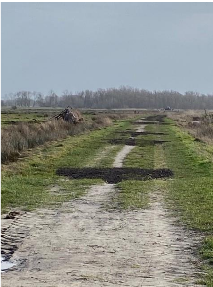
Asfalt granulaat op Achtermadeweg zonder enige noodzaak