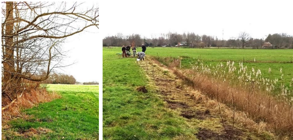
Aanplant veldstruweel houtwal Onneres voorjaar 2023

In een hoek van de Onneres is de zoom van een bomenrij verbreed met vogelvriendelijk struweel (o.a. vlier, Gelderse roos, lijsterbes). Op zes locaties zijn solitaire eiken geplant. Ze geven diepte aan de openheid, schaduw voor het vee en vormen een belangrijk micromilieu voor vele insecten en vogels. Het struweel is voor een klein deel beschadigd door reeën, de eiken hebben het helaas door de droogte deze zomer toch niet gered en zullen in het najaar worden vervangen.